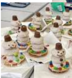
süße Schneemänner zu Weihnachten