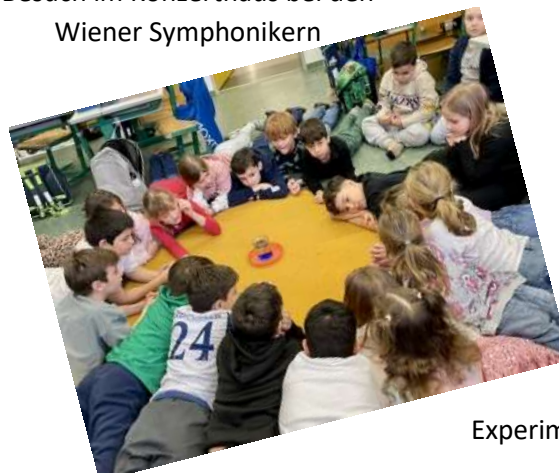
Experimentieren mit Tinte